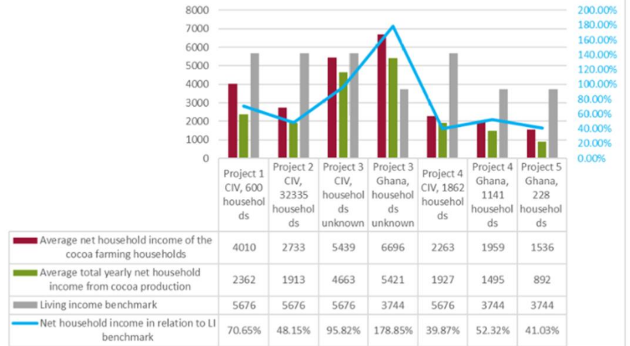
Figure 7: Net household income in relation to LI benchmark per project/program

Note: The left hand scale corresponds to the "yearly net household income", it is used by the bar graphs. The right hand scale compares the average yearly net household income to the living income benchmark of the country; it refers to the blue line graph shown on top of the bar graph.